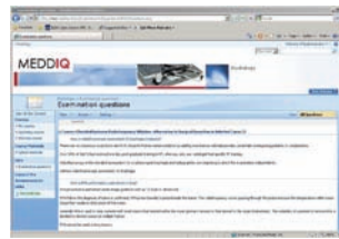
Formulieren der Kursfragen