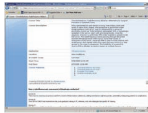
Anlegen eines speziellen Kurses (Metadaten-Eingabe)