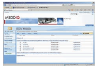
Bereitstellung der Kursdaten