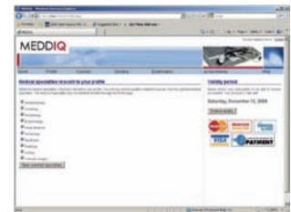
Auswählen der relevanten Fachgebiete