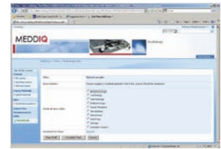
Auswahl der relevanten Fachgebiete