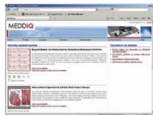
Anzeige der Kurse