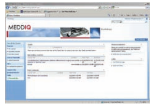
Anlegen einer Kurs-Seite (Kurs-Subsite)

Kursanbieter befüllen die zur Verfügung gestellten Kurstemplates mit Kursinhalten, legen die Inhalte für die Tests fest, stellen Kursmaterial zum Herunterladen bereit und bestätigen die erfolgreiche Kursteilnahme.