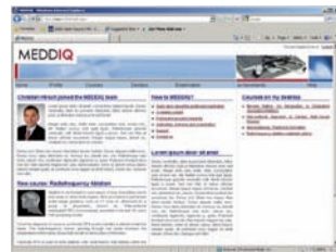
Homepage des Portals

Kursteilnehmer buchen nach erfolgreichem Anmelden die für sie interessanten Kurse, nehmen am Kurs teil (online oder vor Ort)