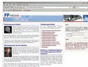
Anmelden mit Login-Daten